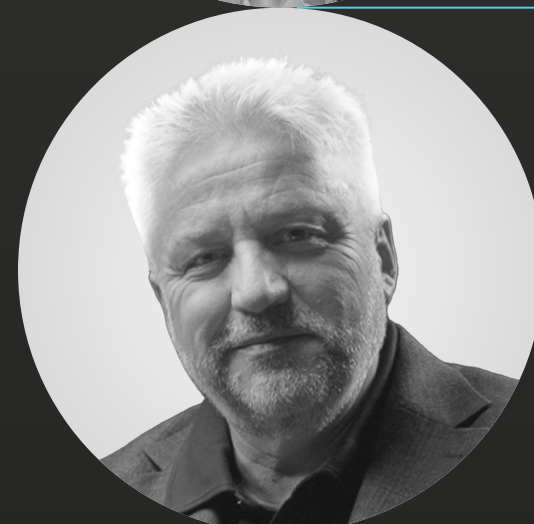
Álex Rovira Autogestión y propósito