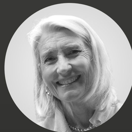
Amy Edmondson Transformación organizacional

En este documento encontrarás los aprendizajes de nueve mentes brillantes del World Business Forum Bogotá 2025: ideas que te ayudarán a liderar a través de lo impredecible, diseñar culturas resilientes y crear valor estratégico en medio de la incertidumbre global.